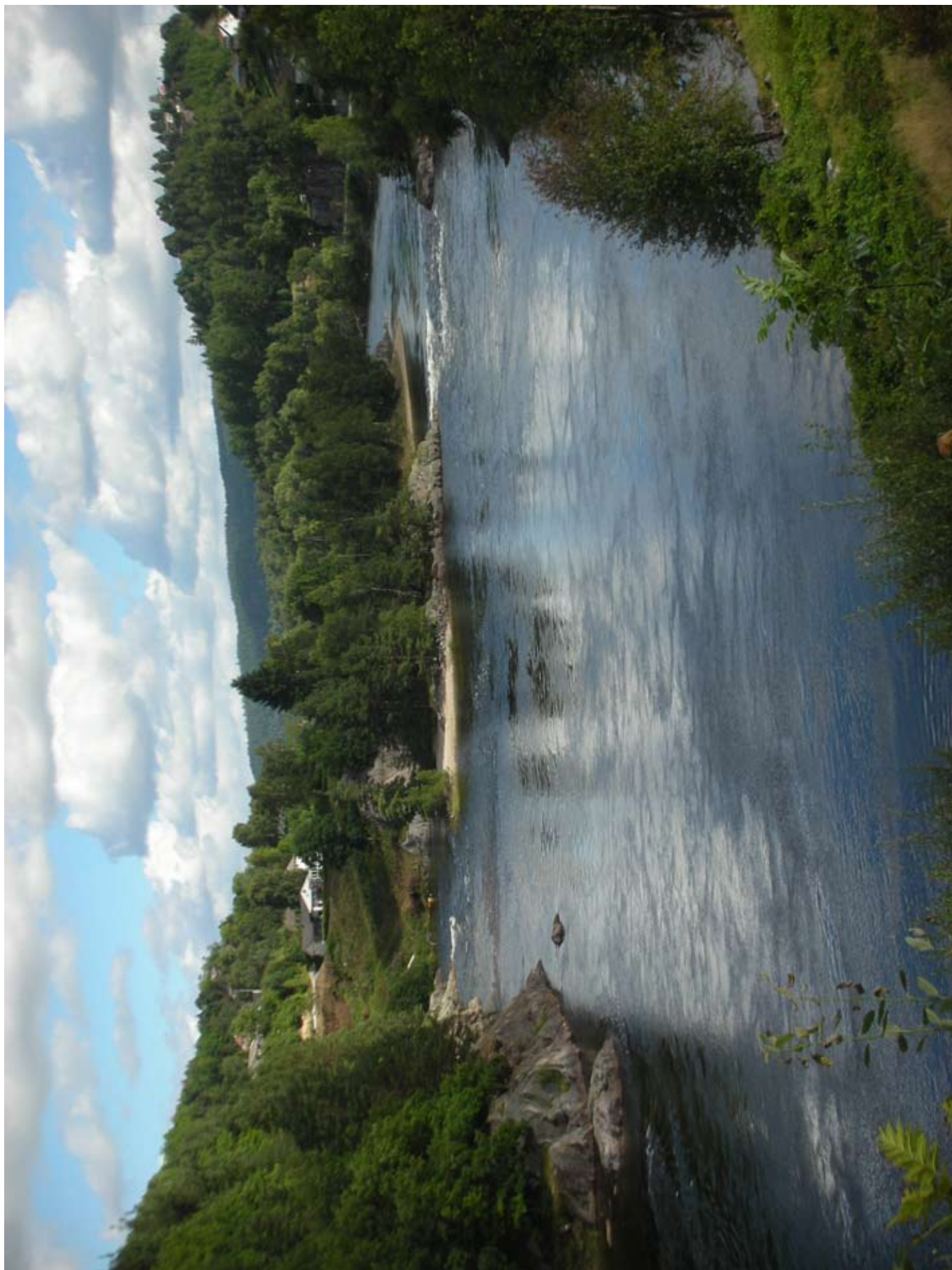
Stemningsbillede fra tidligere fisketur