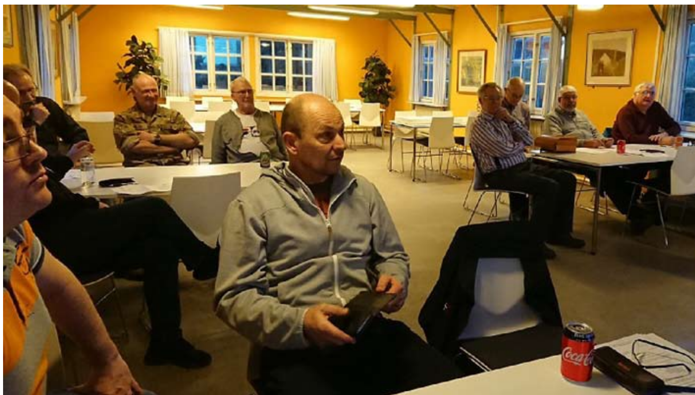
Fremmødte gæster til generalforsamlingen